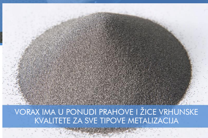
VORAX IMA U PONUDI PRAHOVE I ŽICE VRHUNSKE KVALITETE ZA SVE TIPOVE METALIZACIJA

mogu se naštrcavati korištenjem argona kao inertnog plina za transport praha s izvrsnim rezultatima. Pri ovakvom načinu rada, optimalne postavke tlakova potrebno je odrediti iskustveno.